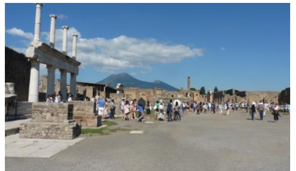
Pompei – Forum... et Vésuve