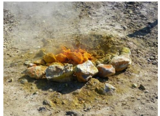
Solfatare – Intérieur du volcan

La visite intérieure du volcan (photo) est actuellement suspendue par suite d'un accident grave