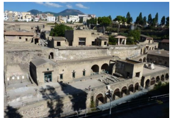
Herculaneum – fouilles, ville moderne et... Vésuve