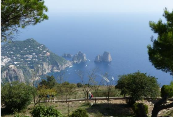
Capri – les Iles Faraglioni, vues du Mont Solaro