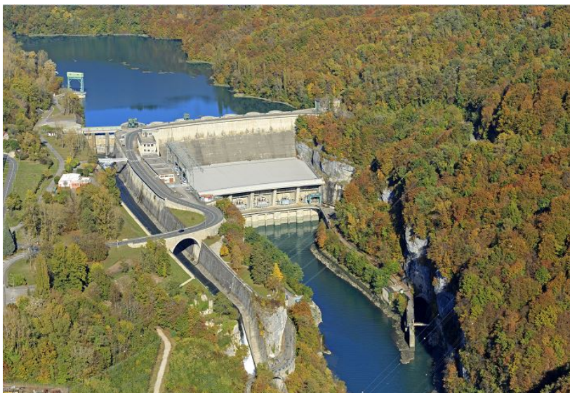
Barrage de Génissiat