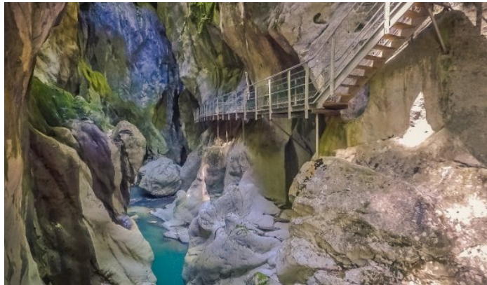
Gorges du Pont du Diable

(programme répondant aux conditions de l'article R211-4 du Code du Tourisme)