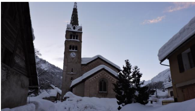
Névache Ville Haute

Autocar ( dép. 14h45 ) pour Modane. Correspondance avec TGV 9252 pour Paris ( arr. 21h18 ) – ou train de nuit.