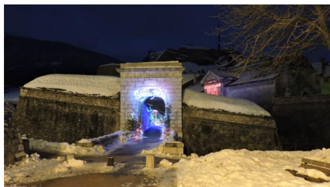
Briançon : Porte de la place d'armes