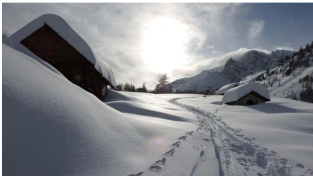
Sur les hauteurs de la Vallée de la Clarée

(programme répondant aux conditions de l'article R211-4 du Code du Tourisme)