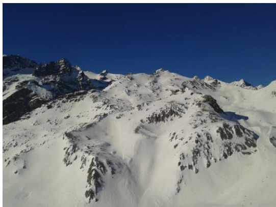
Les Écrins depuis les hauteurs de Monétier

En cas de contrainte, possibilité d'accueil à 19h en gare de Briançon – Prévenir l'accompagnateur.