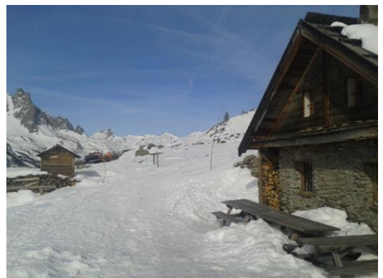
Refuge de Ricou

Départ à 8h45 en minibus privé pour Névache ville haute (1595 m). Randonnée par la route enneigée de Fontcouverte jusqu'au chalet 'la fruitière de Névache'. Puis montée par la route de Ricou jusqu'au refuge du même nom en rive gauche de la Vallée (2115 m).