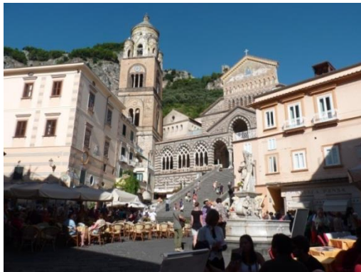
Amalfi – centre-ville et cathédrale

Transfert au port de Sorrente. Départ en hydroglisseur pour Amalfi. Découverte de la côte de la péninsule Sorrentine dans la baie de Naples, passage au large de Capri, puis découverte de la côte Amalfitaine dans le golfe de Salerne.