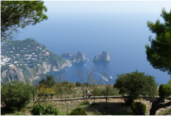
Capri – les Iles Faraglioni, vues du Mont Solaro