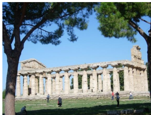
Paestum – Temple d'Athéna