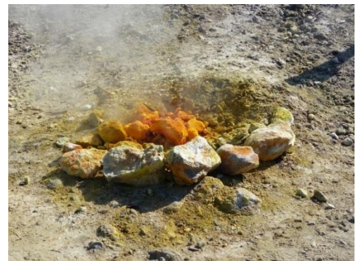
Solfatare – Intérieur du volcan

Puis, visite du Parc Archéologique de Baia , au caractère thermal et hydraulique, lieu de détente privilégié des familles romaines. Baia a subi dans l'antiquité un séisme provoquant la descente lente du sol d'environ 6 m ( phénomène de bradyséisme fréquent dans les Champs Phlégréens ). De nombreuses villas nobiliaires romaines furent englouties et constituent aujourd'hui une partie du Parc sous-marin.