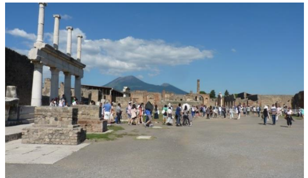
Pompeii – Forum... et Vésuve