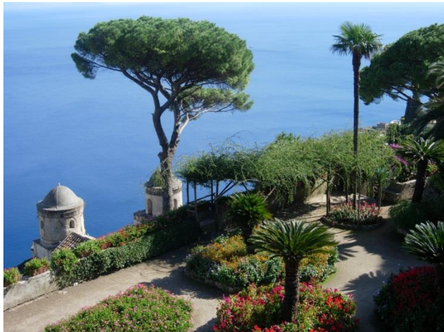
La côte amalfitaine vue de Ravello

(programme répondant aux conditions de l'article R211-4 du Code du Tourisme)